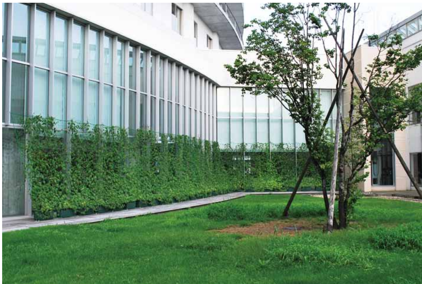
中庭の植木(エゴノキ)と緑のカーテン